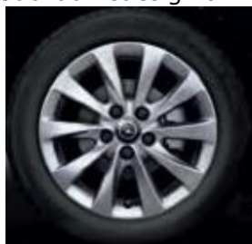
10 Speichen bei 5-Loch Felge

Dies spiegelt sich sofort unter den Sondermodellen "150 Jahre Opel" für Corsa, Astra, Meriva und Insignia wieder. Sie lösen gleichzeitig die Design Edition Serie ab und haben neben spezifischen Komfortausstattungen wie Sitzheizung, Lenkradheizung und Lederlenkrad, Klimmanlage, MP3-CD-Radion, Nebelscheinwerfer, Geschwindigkeitsregler und BC auch spezielle Alufelgen im Jubiläumsdesign an Bord.