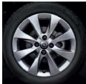
8 Speichen bei 4 Loch Felge (nur Corsa ohne 1,7 CDTI)