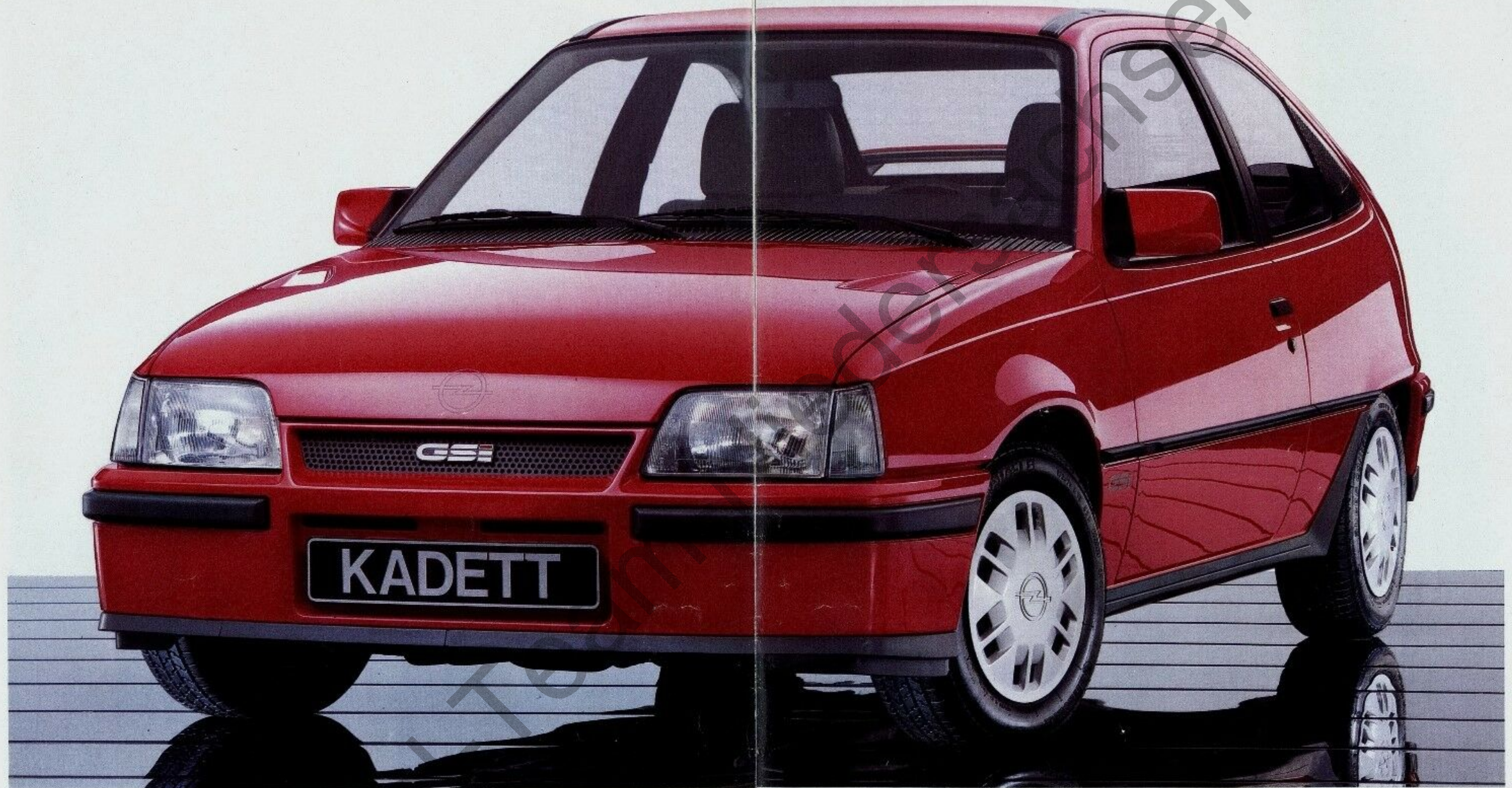
Abb. Kadett GSi. Brillant-Lackierung Sonderausstattung.

Damit der Mensch noch mehr Spaß hat, gibt es den neuen Kadett GSi.