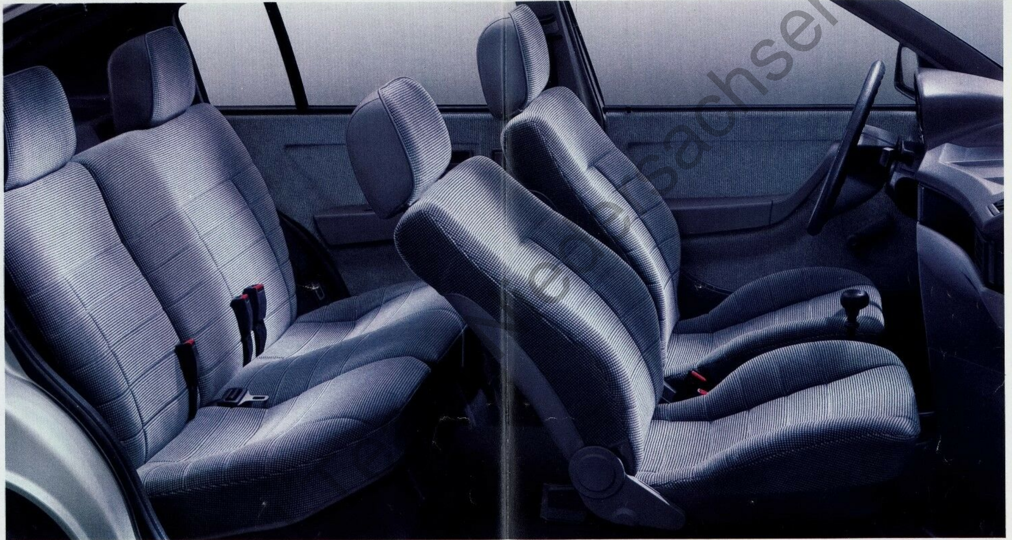
Abb. Kadett GLS. Kopfstützen hinten Sonderausstattung.

Damit der Mensch sich nicht vor der Technik ducken muß, hat der neue Kadett weit öffnende Türen und einen bequemen Einstieg.