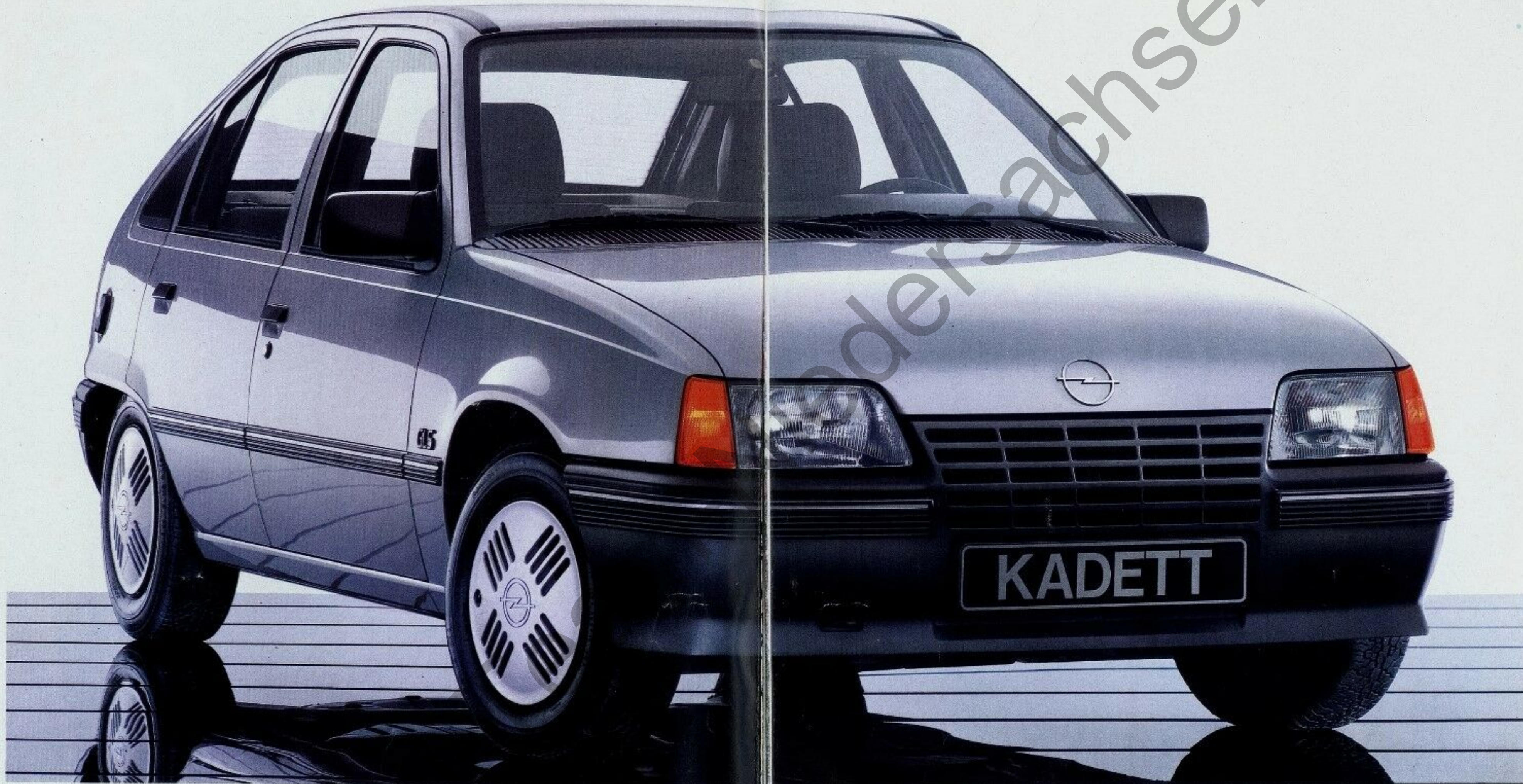
Abb. Kadett GLS. Metallic-Lackierung und 2. Außenspiegel Sonderausstattung.

Bevor wir darangingen, diesen neuen Wagen zu bauen, haben wir erst mal studiert.