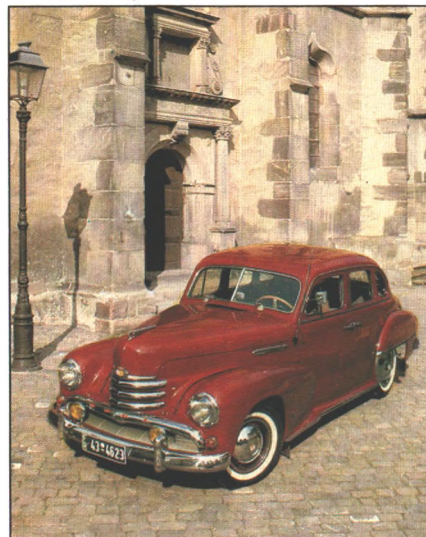
Gut in Schuß: Opel Kapitän, Baujahr 1951