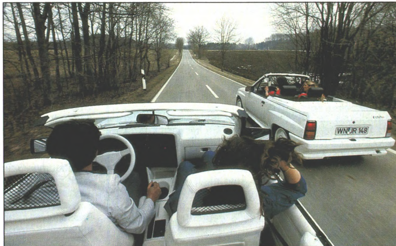
Gut gelüftet: Im Oben-ohne-Opel der Sommer-Sonne entgegen