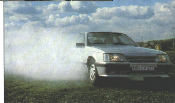
Gut geschützt: Sonder-Senator mit Nebelanlage